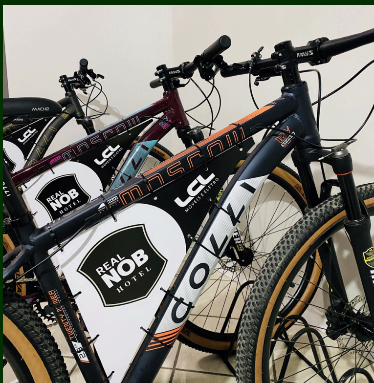
EMPRÉSTIMO DE BIKE