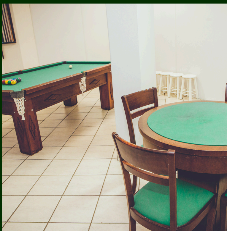
SALA DE JOGOS