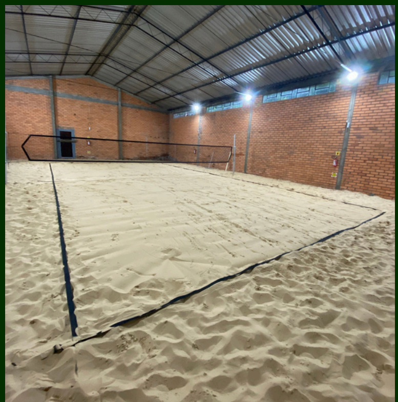
QUADRA COBERTA PARA ESPORTES DE AREIA